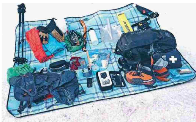
Oprema ob zimskem obisku gora

Ob vsem tem pa je pri obisku gora treba biti obziren in odgovoren do narave in živali, ki so pozimi še zlasti občutljive na zunanje vplive. Zato se, tako Martin Šolar , podpredsednik PZS , držimo ustaljenih poti in se izognimo predelom, ki jih živali uporabljajo za počivanje in prehranjevanje.